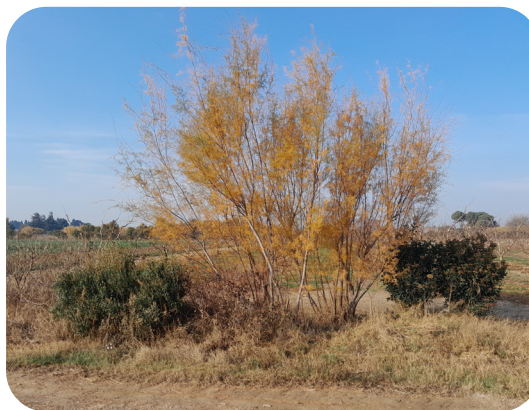
Haie diversifiée en bordure d'une parcelle de pêcheurs

De plus, les haies facilitent l'implantation de la faune auxiliaire en offrant des zones refuges et des voies de déplacement, tels des « couloirs écologiques » favorisant leur reproduction et leur sédentarisation. Le renforcement de cette biodiversité fonctionnelle permet ainsi une meilleure régulation naturelle des différents pucerons du pêcheur.