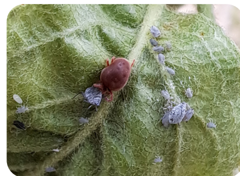
Trombidion soyeux prédatant un puceron cendré sur une feuille de pommier

Le projet a aussi évalué le mélilot contre le campagnol provençal (2022–2023). Là encore, l'hétérogénéité de la levée a montré la difficulté d'implanter des plantes de service dans des vergers établis, et aucun effet sur les populations de campagnols n'a pu être mesuré. De plus, la présence de mélilot a réduit de 20% la circonférence des troncs par rapport au témoin, révélant une forte concurrence hydrominérale au détriment des arbres.