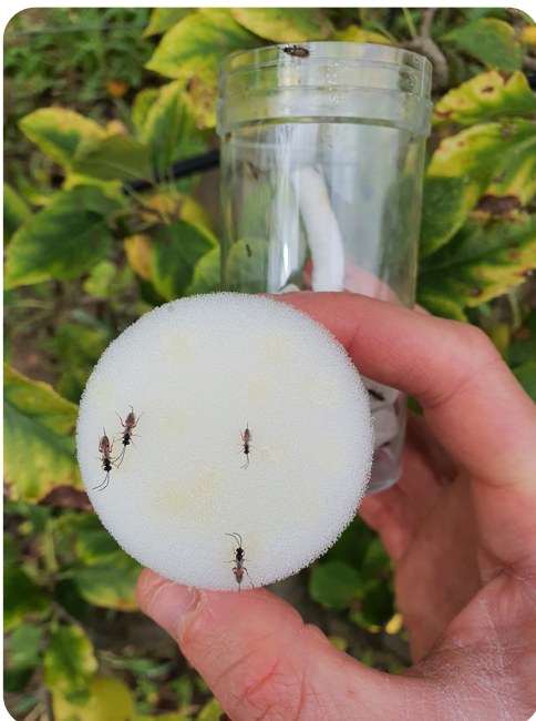
Lâcher de Mastrus ridens en juillet 2024 à SudExpé