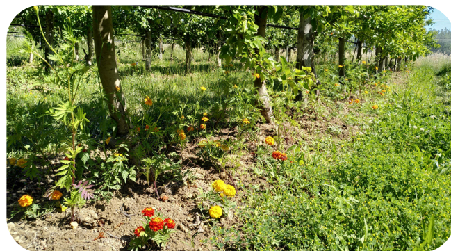
Tagètes dans des rangs de pommiers à SudExpé

Ces aménagements au sein ou en périphérie des parcelles permettent ensuite d'attirer d'autres auxiliaires, renforçant ainsi la biodiversité fonctionnelle et la régulation naturelle des ravageurs.