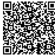
Tableau de synthèse d'efficacité des produits testés sur les maladies en arboriculture

1 : produit de biocontrôle tel que défini dans le code rural article L253-6