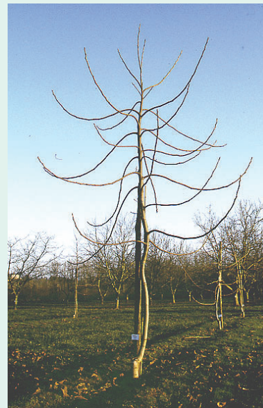
Noyer formé en axe libre avec arcure ou pliage de branches

Pour les vergers conduits en haie fruitière en variété Lara notamment, les arbres sont plus proches et ne sont plus considérés dans leur individualité mais comme un ensemble formant un mur fruitier. Les essais de taille d'entretien réalisés sur les côtés par fauchage mécanique sont à l'étude sur la Station de Creysse depuis 1995. L'avantage de cette pratique est de limiter considérablement le temps de taille et d'avoir des coûts de ce fait réduits. Le meilleur compromis semble consister à tailler un côté de la haie fruitière alternativement tous les 3 à 4 ans.