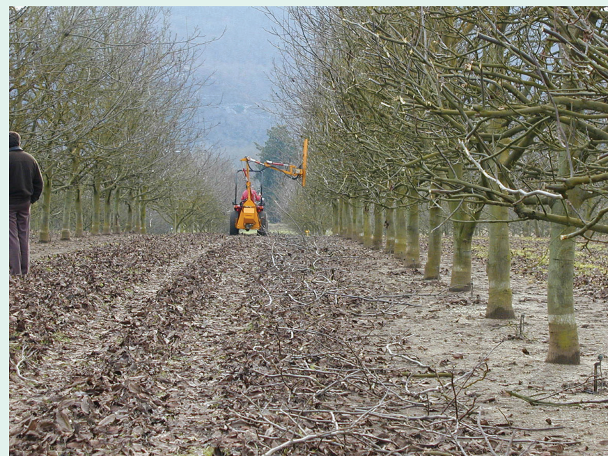
Haie fruitière taillée mécaniquement avec scies circulaires en hiver