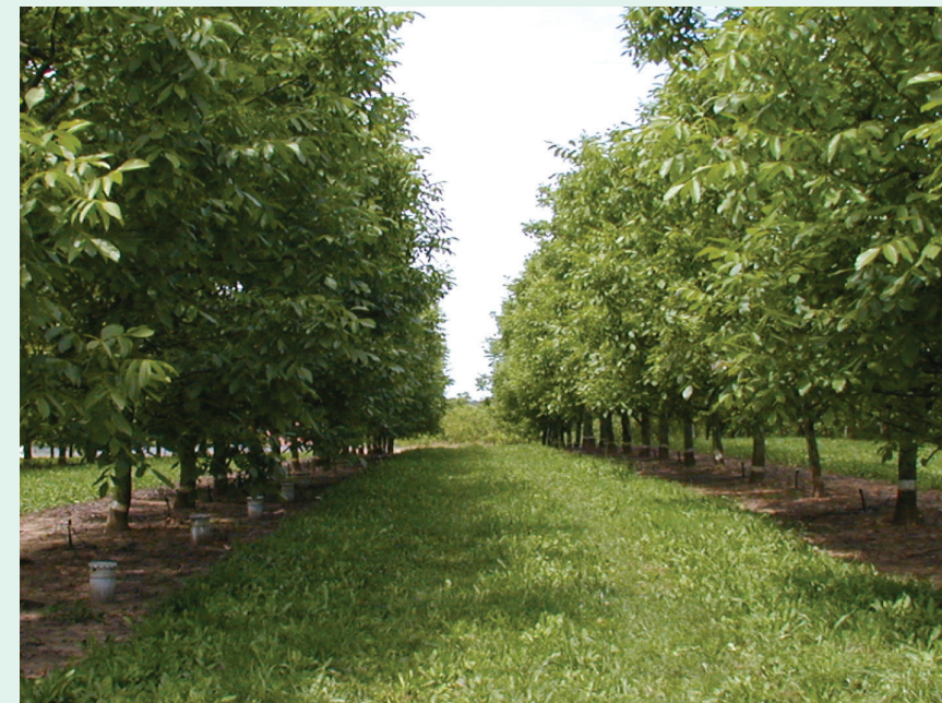
Vergers Lara conduit en haie fruitière 8 m par 4 mètres